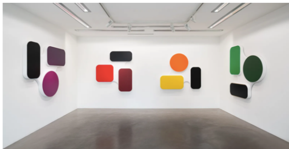
Les tableaux-sculptures de Ora-Ito Stéphane ABOUDARAM | WE ARE CONTENT(S)

La grammaire du premier n'est pas absente des œuvres du second, cependant. Se révèle plutôt l'unité sous-jacente du travail de celui qui n'a jamais cessé d'être actif depuis son entrée fracassante dans le monde du design avec ses piratages de marque de luxe, au début des années 2000, multipliant par la suite créations iconiques (pour Heineken, Cassina, Guerlain...), réalisations industrielles ou aménagements urbains.